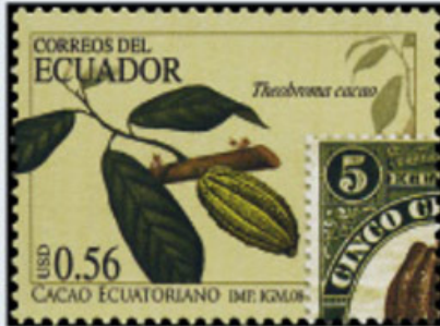
Image du timbre n° 287 de 1930 (cabosse) répartie sur les quatre valeurs.

2008. - 1 er octobre, journée mondiale du cacao. Le cacao équatorien. Offset. Multicolore. Filigrane B. Dentelés 13¼ x 13.